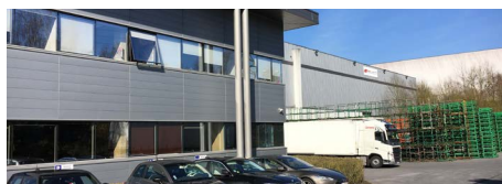
ENTREPÔT DE SAINT-WITZ ZAC de la Pépinière 4 avenue de la Pépinière 95470 Saint-Witz