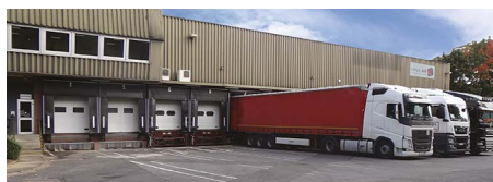
ENTREPÔT DE TORCY Z.I. Torcy Sud 8 rue des Épinettes - Bât A 77600 Bussy-Saint-Martin